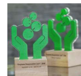
Chaque année, les trophées Responsible Care récompensent vos réalisations RSE

Il est accompagné d'un nouvel outil d'autoévaluation simple d'utilisation permettant de visualiser les actions prioritaires à mettre en œuvre dans le cadre de la démarche RSE et d'aider à la prise de décision.