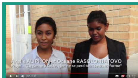
Concours « Parlons chimie »