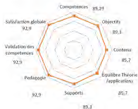
Enquête de satisfaction des participants Management de la sécurité - Jeu pédagogique 2019

En 2019, les 11 joueurs ont répondu à une enquête de satisfaction permettant de confirmer leur intérêt.