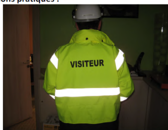
Repérage clair des visiteurs