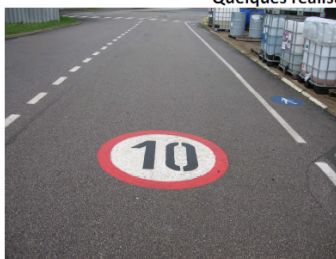
Marquage et cloisonnement des voies de circulation